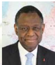
D. Babatunde Osotimehin