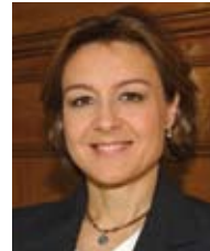
Dña. Isabel García Tejerina