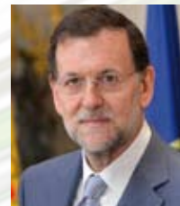
D. Mariano Rajoy Brey