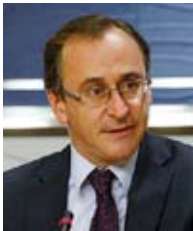
D. Alfonso Alonso

11.15-12.00 h. Conferencia-Marco: "El Futuro en Igualdad" , a cargo de D. Alfonso Alonso. Ministro de Sanidad, Servicios Sociales e Igualdad y Dña. Samira Merai Fria, Ministra de la Mujer y de la Familia de Túnez. / Framework Conference: "The future in Equality" , by D. Alfonso Alonso. Minister of Health, Social Services and Equality and Minister of Women and Family of Tunes.