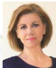
Dña. M a Dolores Cospedal