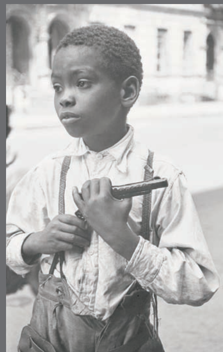
Nueva York, ca. 1939. Colección privada © Estate of Helen Levitt

Esta exposición, producida por la Fundación ICO, es la primera muestra antológica organizada tras su fallecimiento en 2009. Presenta cerca de 140 imágenes, realizadas desde 1936 hasta la década de los 90, así como la película documental In the Street (1945), precursora del cine americano independiente. La muestra subraya cómo las imágenes de Levitt han configurado la estética de la instantaneidad en la street photography, con su capacidad de suspender el movimiento, fijar pequeños momentos y romper la continuidad del flujo de lo real con una inagotable potencia visual.