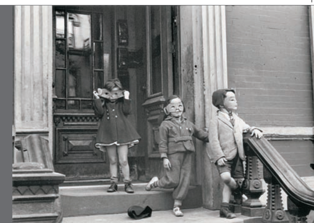
Nueva York, ca. 1942. Colección privada © Estate of Helen Levitt

This exhibition, produced by the ICO Foundation, is the first anthology organised since her death in 2009. It presents close to 140 images taken between 1936 and the 1990s, and the documentary In the Street (1945), a precursor to independent American cinema. The show underlines how Levitt's images set out the aesthetics of instantaneity in street photography, with her ability to suspend movement, capture tiny moments and break the flow of reality with an endless visual power.