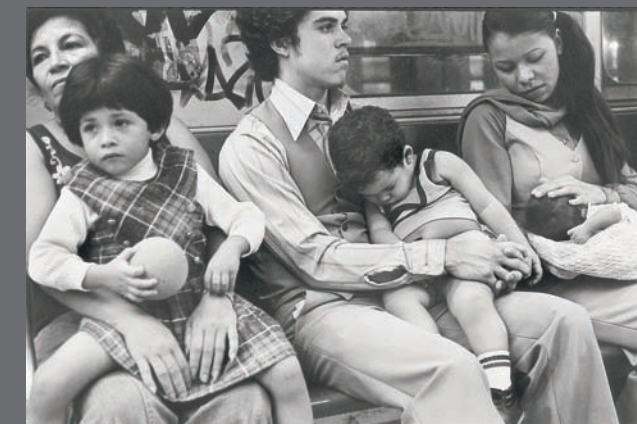
Nueva York, ca. 1983.