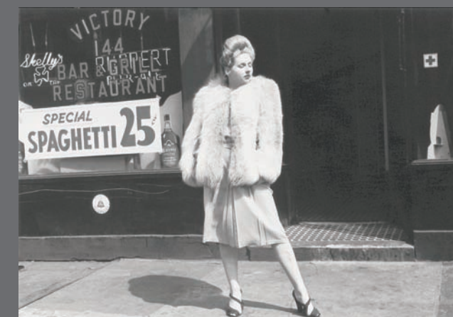
Nueva York, 1939.