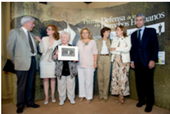
Premio a la defensa de los derechos humanos