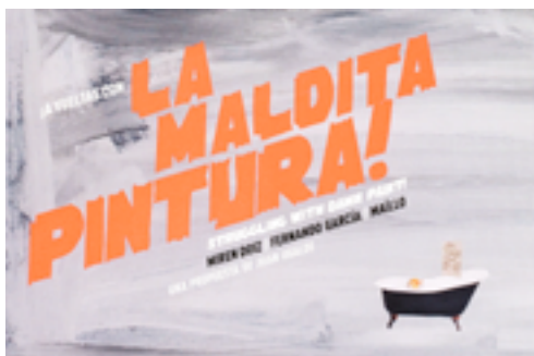
Cartel de la exposición ¡A vueltas con la maldita pintura!

De las exposiciones El poder de la duda y ¡A vueltas con la maldita pintura! , se editaron los correspondientes catálogos que profundizaban en la obra de los artistas incluidos en ambas.