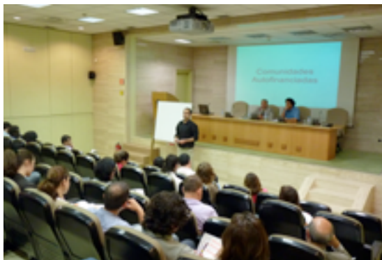
Presentación de las Comunidades Autofinanciadas (CAF) en el Auditorio del ICO

Fundación ICO y ACAF han realizado cuatro sesiones formativas en Madrid, Valencia, Barcelona y Sevilla de las que se ha derivado la creación de 11 nuevas CAF. La colaboración ha impulsado asimismo el desarrollo de la Plataforma Winkomun, una aplicación (APP) de e-learning digital y financiera. Esta hará posible una expansión exponencial de la metodología en España, en Europa y Estados Unidos.