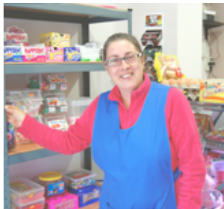
Apertura del negocio de una usuaria del Proyecto Piloto de Microcréditos

El vínculo de las personas a los grupos se ha fortalecido, el procesamiento grupal de las iniciativas se reafirma como actividad de educación financiera y la confianza desarrollada entre los miembros de los grupos, con las entidades financieras prueba ser el motor de transformación de apoyo a la acción social esperado en el proyecto. La evaluación de impacto del proyecto, en particular de su metodología, iniciada en 2010 continúa, habiendo rebasado la 2ª medición entre los usuarios de Huelva y Sevilla. El proyecto fue presentado por cinco de las personas usuarias de sus servicios en la Cumbre Mundial del Microcrédito en Noviembre de 2011 en Valladolid. Fue recibido con gran entusiasmo por el sector de las microfinanzas internacional y constituyó una muestra única de innovación en este terreno en España.