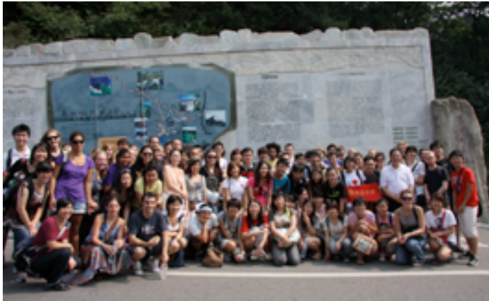
Becarios de la Fundación junto con otros compañeros, visitan la Gran Muralla

El programa consistió en un curso académico en la Universidad de Pekín y cubrió, además de la formación, el viaje, el alojamiento y la manutención durante un curso académico. A lo largo del periodo los becarios disfrutaron de diversas visitas a empresas e instituciones españolas presentes en Pekín, como la Embajada Española, el Instituto Cervantes o el Banco Santander. Algunos becarios también realizaron prácticas en instituciones o empresas en Pekín.