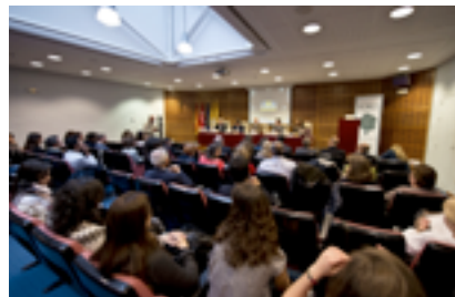
Acto de Inauguración del II Encuentro Nacional de Microfinanzas

Asistieron más de 100 personas representando a cerca de 70 instituciones nacionales e internacionales del sector de las microfinanzas. En las mesas redondas participaron todos los integrantes del grupo de trabajo de legislación existente y en activo en 2011. Como en el primer Encuentro se realizó el curso de iniciación a las microfinanzas con cerca de cien personas inscritas.