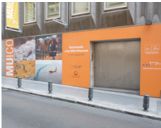
Vista de la fachada del Museo ICO durante la exposición Retratando las Microfinanzas

Desde 2006, este concurso anual ha contado con casi 4.000 participantes que representan a todas las regiones del mundo.