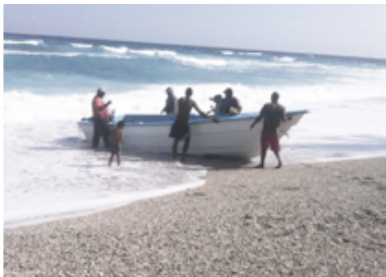
Miembros de la cooperativa pesquera con una nueva embarcación

Los Planes Estratégicos de Desarrollo de Barahona y Pedernales están siendo elaborados a partir del modelo de actuación del proyecto aunque será en el cuarto y último año de trabajo en el que serán concluidos y validados por las administraciones locales.