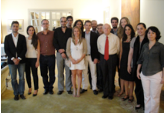
Becarios de la promoción 2011-2012 fueron recibidos por el embajador de España en China