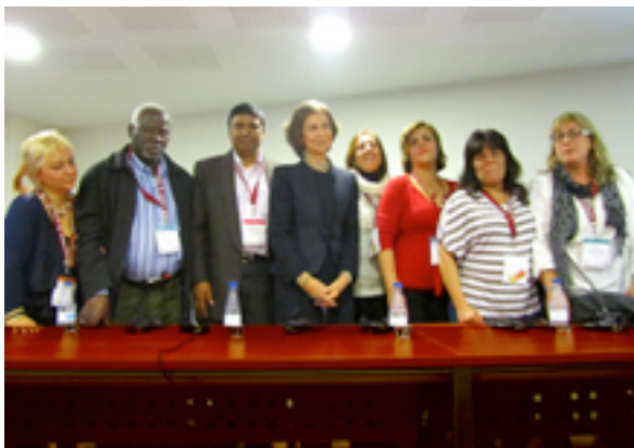
Grupo de usuarios del Proyecto Piloto de Microcréditos con S. M. la Reina Doña Sofía durante la Cumbre

La implicación de la Fundación ICO en la Cumbre se desarrolló en diferentes facetas. El diseño de las mesas de la Pista Española y de las Plenarias contó con la participación de la Fundación ICO en más de diez teleconferencias con la organización Results, promotora de la Campaña Global del Microcrédito. El convenio firmado con Results, tuvo como objetivo financiar la edición española de “Further Pathways out of Poverty”, “Nuevos Caminos para salir de la pobreza”, obra que recopilaba todos los ponencias presentadas en las sesiones plenarias de la Cumbre.