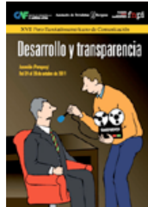
Desarrollo y transparencia

directores de medios, representantes políticos y expertos de América Latina y Europa, impulsando análisis y debates sobre temas de actualidad en lo relativo a economía, desarrollo democrático, política y periodismo.