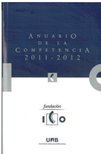
Portada del Anuario de la Competencia 2011-2012.