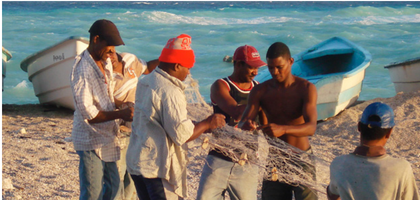
Grupo de Pescadores pertenecientes al proyecto de Barahona.

En el cuarto y último año de este proyecto los objetivos se centraron en la consolidación de la actividad de las empresas creadas en los pasados años: