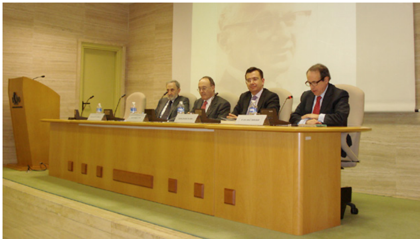
Intervinientes en la presentación del libro “Capitalismo y libertad. Ensayos de política monetaria”.