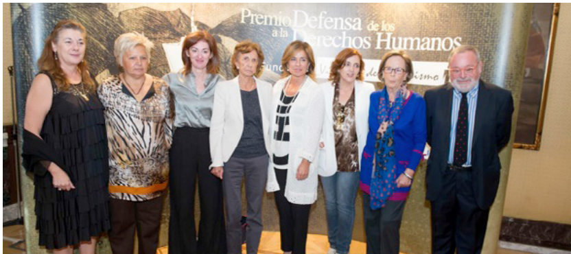
Momento de la entrega del Premio a la Defensa de los Derechos Humanos 2012.

El acto de entrega del Premio tuvo lugar en el Palacio de Zurbano, de Madrid, y estuvo abierto a los medios de comunicación.