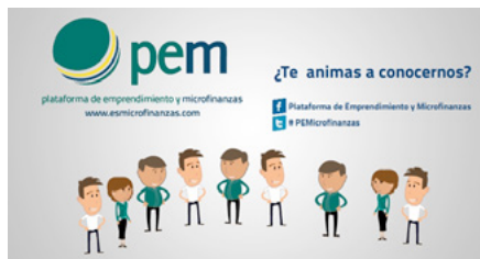
Logotipo Plataforma Española de Microfinanzas.

La nueva Plataforma de Emprendimiento y Microfinanzas ( http://www.emprendimientoymicrofinanzas.com ) pone al alcance de los emprendedores todos los recursos disponibles del sector microfinanciero en España para que puedan crear o consolidar un pequeño negocio.