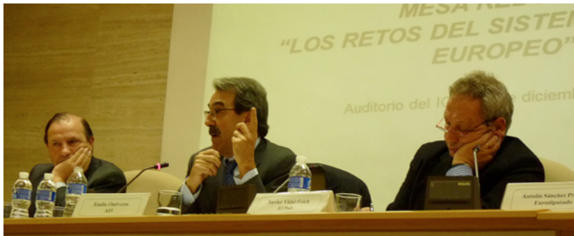
Intervinientes en el debate “Los retos del sistema bancario europeo” .

La Fundación ICO y la Fundación Alternativas colaboraron en la celebración de este debate con el fin de analizar un asunto de enorme trascendencia para Europa y para España: ¿Cuáles son los retos actuales del sistema financiero? ¿Qué reformas se están llevando a cabo en los principales países y bancos europeos para su saneamiento? ¿Cuál sería la hoja de ruta para la unión bancaria y la unión fiscal y política? Para debatir y clarificar de cara a los agentes políticos y económicos y ciudadanía este proceso, se congregó en una mesa redonda a destacadas personalidades del mundo de la política europea y española, la banca, la universidad, y los medios de comunicación. El acto tuvo lugar en el Auditorio del ICO el 13 de diciembre.