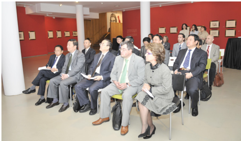
Visita al Museo ICO de los profesores de la Escuela Central del Partido Comunista de la República Popular China.

El programa está organizado por el ICEX y gracias a él parte del profesorado de esta Escuela tiene la ocasión de conocer de primera mano nuestro país, así como nuestro sistema institucional, legal y financiero.