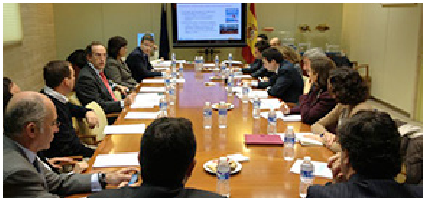
Intervinientes en el Seminario “La ley Concursal y la financiación de la empresa española”.