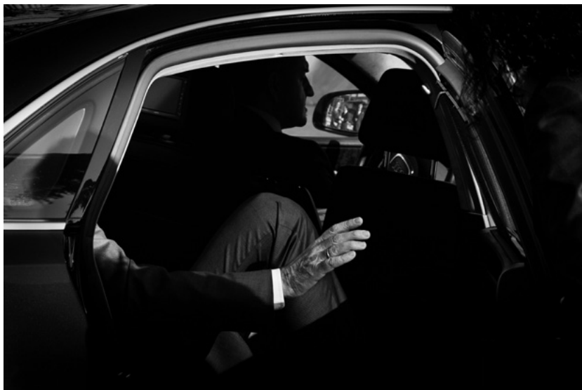
Fotografía “La mano del poder” de Eulogio Valdenebro, ganadora del Premio Imagen del Parlamento.