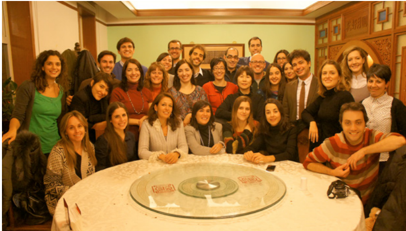
Encuentro de representantes de la Fundación con los becarios.

En ese mismo viaje, representantes de la Fundación visitaron las residencias en las que viven los becarios y mantuvieron un encuentro con ellos. Así mismo, se reunieron con empresas e instituciones españolas con sede en China con el fin de buscar fórmulas de colaboración.