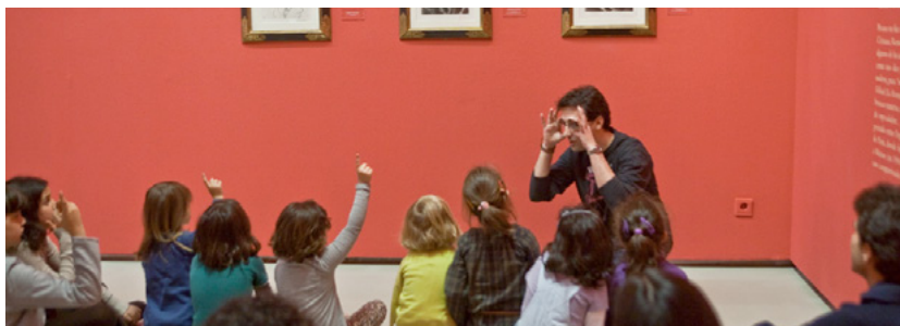
Grupo de niños en los talleres infantiles del Museo ICO.

Diseñados como acercamiento pedagógico de las exposiciones temporales del Museo ICO a niños de entre 6 y 12 años. Los talleres infantiles, destinados a centros escolares de Educación Primaria, contaron con la asistencia de 833 visitantes, y los talleres en familia con la de 918.