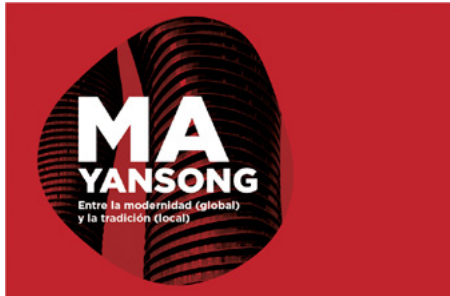
Imagen diseñada para la exposición Ma Yansong

individual de Ma Yansong en España, presentó una amplia selección de maquetas articuladas en torno a su búsqueda de una nueva identidad del territorio, objetivo que consigue mediante la introducción de la naturaleza en el contexto urbano y viceversa.