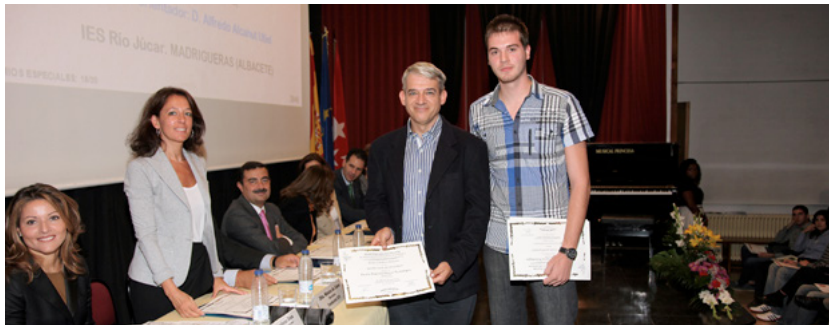
Momento de la entrega del Premio Arte patrocinado por la Fundación al alumno galardonado y su profesor.

La entrega de los premios tuvo lugar en el mes de octubre en las instalaciones del mismo Colegio San Viator en Madrid.