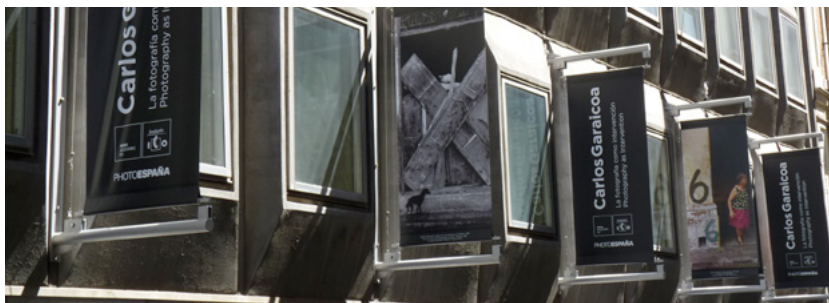
Banderolas anunciando la exposición de Carlos Garaicoa.

formato que muestran un interés inicial por lo documental. También reunió una selección de imágenes a color de mayor tamaño con un marcado interés por los espacios arquitectónicos y urbanos de numerosas ciudades, así como obras más recientes que exploran los límites de la fotografía tradicional: imágenes con dibujos en hilo, impresas sobre metal y estuco, intervenidas con láser o con impacto de balas o realizadas a relieve en poliestireno.