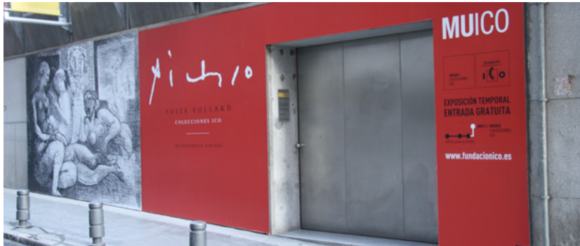
Fachada del Museo ICO anunciando la exposición de la Suite Volland.

mediante la exposición de varias de las obras de este artista presentes en las Colecciones ICO: una escultura, un dibujo y tres grabados.