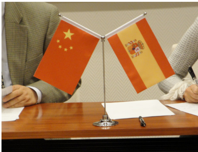
Momento de la firma del convenio con UIBE.

En esta convocatoria 2012-2013 la Fundación recuperó el acuerdo con la University of International Business and Economics (UIBE), al tiempo que mantenía en vigor el que tenía con la Universidad de Pekín (PKU). Por otro lado, a finales de año una delegación de la Fundación viajó a Pekín y, además de renovar los convenios firmados con la PKU y UIBE, visitó la Beijing Normal University (BNU), con la que llegó también a un acuerdo. El convenio con BNU se firmó en diciembre de cara a contar con esta universidad en próximas convocatorias.