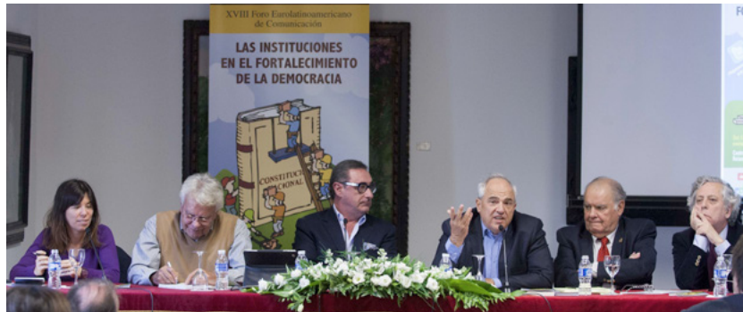
Intervinientes en el Foro Eurolatinoamericano de Comunicación.

Contó con figuras relevantes como el expresidente de España, Felipe González, y de Colombia, Ernesto Samper, y el Presidente de la Secretaría General Iberoamericana, Enrique Iglesias o el exministro Carlos Solchaga, entre otros.