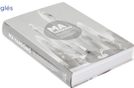
Ejemplar de un catálogo de la exposición "Ma Yansong. Entre la modernidad (global) y la tradición (local)".