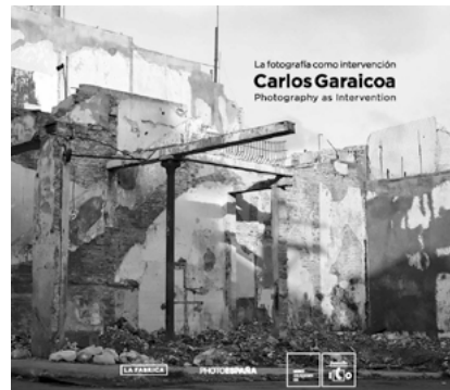
Portada del catálogo de la exposición de "Carlos Garaicoa. La fotografía como intervención".

Editado en colaboración con La Fábrica Editorial. Edición bilingüe español/inglés.